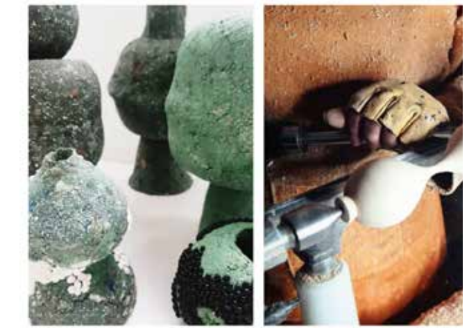
Homo Faber 2024: la mejor artesanía en un escenario de cine

Cerca de 12.000 amantes del cómic y manga pasarán por la Feria de Valladolid Una feria para celebrar el aniversario de un género que se vive en un momento de esplendor y que atrae a un público cada vez más joven y diverso. La feria de cómics y manga de Valladolid, que se celebra del 14 al 16 de marzo en el Palacio de Congresos y Exposiciones, es una de las más importantes de España. Este año, la feria cuenta con una programación especial que incluye talleres, exposiciones y actuaciones musicales. Además, se celebrará el concurso de dibujo 'Feria de Cómics y Manga de Valladolid', que invita a los participantes a crear obras que reflejen su visión del mundo del cómic y el manga.